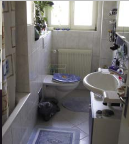
Die Bäder wurden vollständig erneuert.

im Grundriss unverändert. Das dritte Zimmer jedoch, zusammen mit Bad und Küche gegen die lärmige Verkehrsader ausgerichtet, liess sich nur ungenügend nutzen. Deshalb beschloss man, die Zwischenwand zur Küche zu entfernen und eine Wohnküche einzurichten. Auf die Tür vom Korridor zur Küche liess sich wegen der nunmehr offenen Struktur verzichten, wodurch