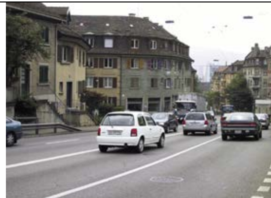
Visualisierung: Zetiecht GmbH

Dank geschickter Visualisierungen konnten sich die MieterInnen mit dem Projekt vertraut machen.