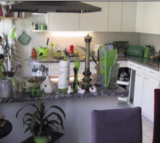
Die neue Küche mit Kochinsel und Essraum.